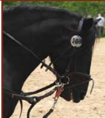
Zu viel, zu eng – jede Art von Ausrüstung sollte kritisch hinterfragt werden!

Nicht nur einengende Hilfszügel, sondern auch andere Ausrüstungsgegenstände sind unter Tierschutzgesichtspunkten kritisch zu sehen. Dazu gehören vor allem Reithalter. Einige Modelle sind grundsätzlich abzulehnen, da sie unweigerlich Druck und Schmerz am empfindlichen Pferdekopf verursachen. Andere Reithalter müssen so verschnallt werden, dass Atmung und Kautätigkeit des Pferdes nicht behindert werden.