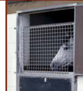
Reine Boxenhaltung macht erwiesenerweise Pferde krank.

Der mit Boxenhaltung verbundene Bewegungsmangel ist verantwortlich für eine ungenügende Selbstreinigung der Atemwege, für Beeinträchtigungen der Darmperistaltik sowie Störungen des Hufmechanismus und führt so zu einer Häufung von Atemwegserkrankungen, Koliken und Degenerationerscheinungen im Bereich des Hufes. Zudem kommt es infolge des Bewegungs- und Reizmangels häufig zu Verhaltensstörungen. Unabhängig von Nutzung und Rassetyp ist die Wahrscheinlichkeit für das Auftreten einer Verhaltensstörung umso größer, je weniger Bewegungsmöglichkeit ein Pferd hat und je höher sein Bewegungsdrang ist. Zudem verursacht der Bewegungsmangel Schwierigkeiten im Umgang und beim Einsatz der Pferde.