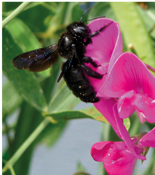
Erst auf den zweiten Blick als Biene zu erkennen

Kurze Zeit später erreichen die Drei den Park und schließen ihre Fahrräder an. „Ist das heute warm!“, seufzt Tom und wischt sich die Schweißperlen von der Stirn. „Dort drüben ist ein Eisstand. Was haltet ihr von einem Eis als Belohnung für die Fahrt?“, fragt Tina. „Ich will Erdbeere!“, ruft Elena begeistert. „Ich Waldmeister“, verkündet Tom und rennt zum Eisstand. Die Drei setzen sich mit ihrem Eis