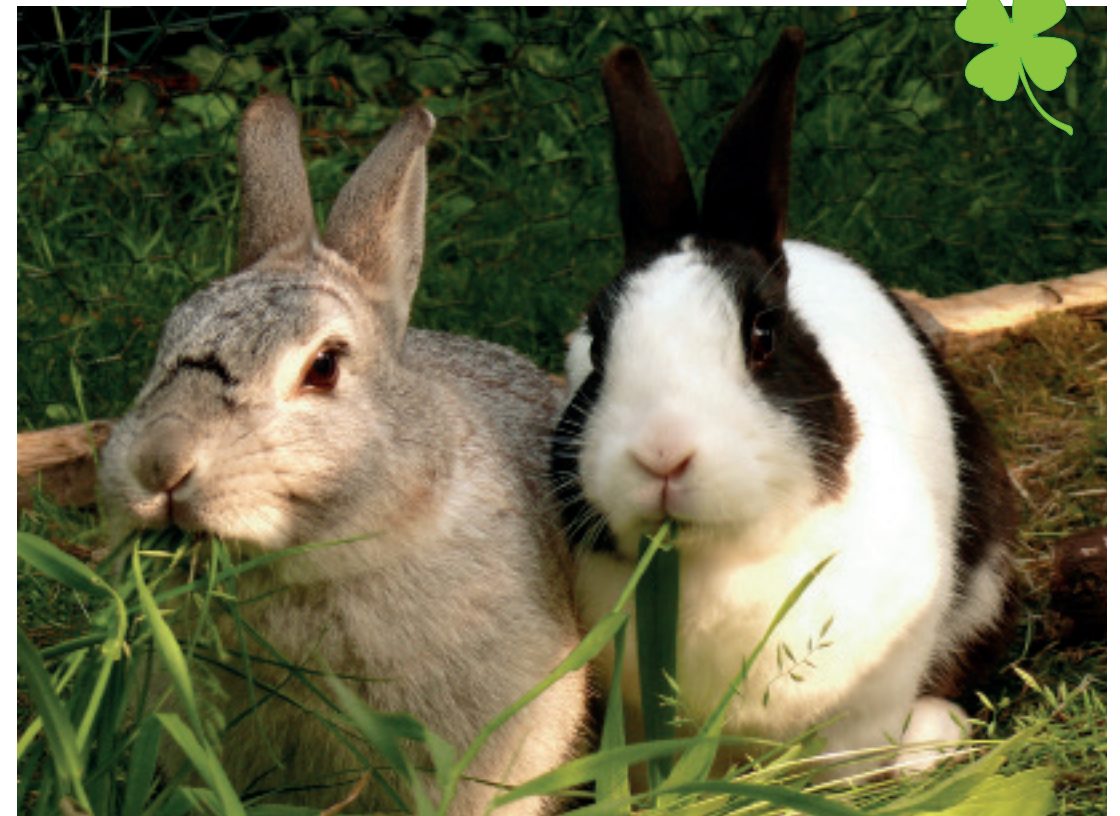
Flocki und Mümmel im neuen Gehege