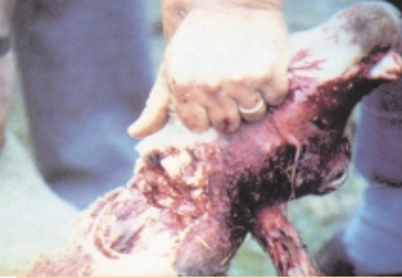
Bei vollem Bewusstsein verbluten