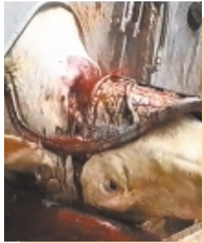
Rinderschächtung in Frankreich