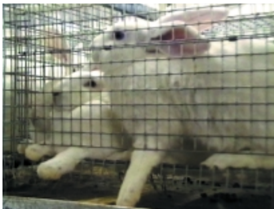
ein Leben hinter Gittern