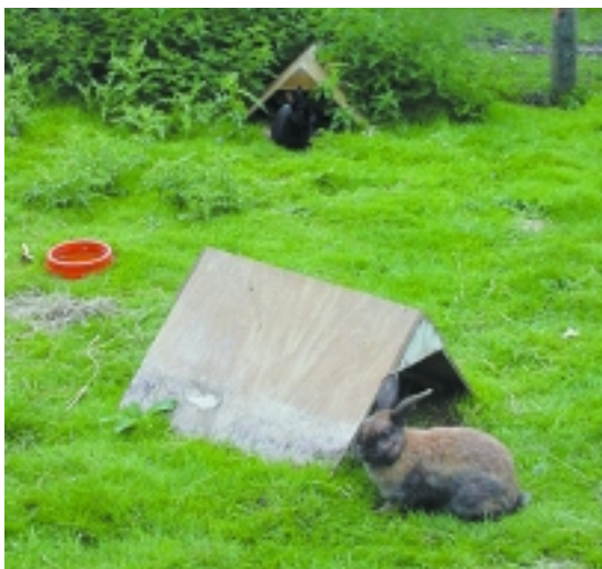
Weide, Deckung, Gruppenhaltung